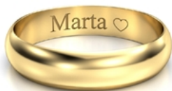
Mały druk pojedyncze serduszko