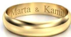
Mały druk Dwa imiona ze znakiem „and”