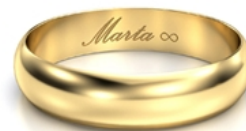
Kaligrafia znak nieskończoności